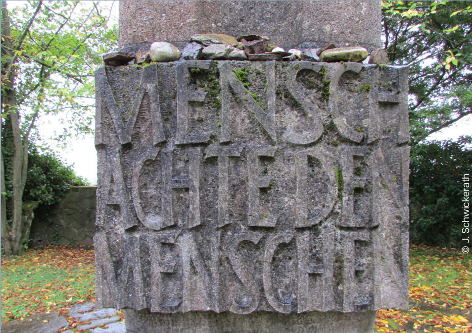
Gedenkstele auf dem ehemaligen Anstaltsfriedhof in Hadamar mit der Inschrift “Mensch achte den Menschen”